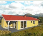
Stockholm 87,10 m 2 4 Zimmer